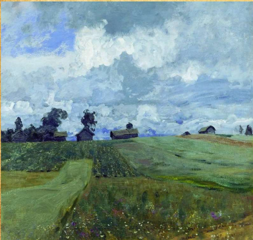
«Бурный день» 1897 год

Во время болезни живописец не прекращал работать. В этот период он создал экспрессивные полотна «Бурный день», «Последние лучи солнца. Осиновый лес», «Поезд в пути»