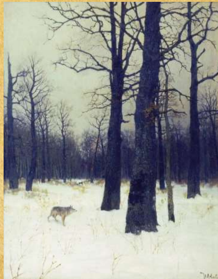
«Зимой в лесу» 1885 год