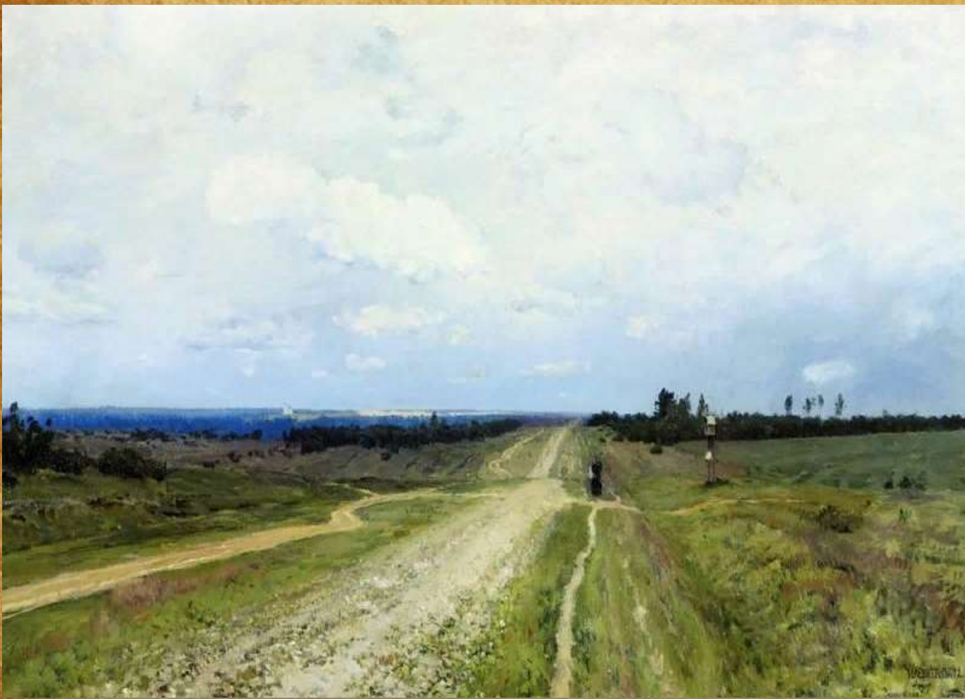
«Владимирка» 1892 год

А затем высылка из Москвы. Именно в своей вынужденной ссылке Исаак Левитан пишет одну из самых своих глубоких и талантливых работ – «Владимирка».