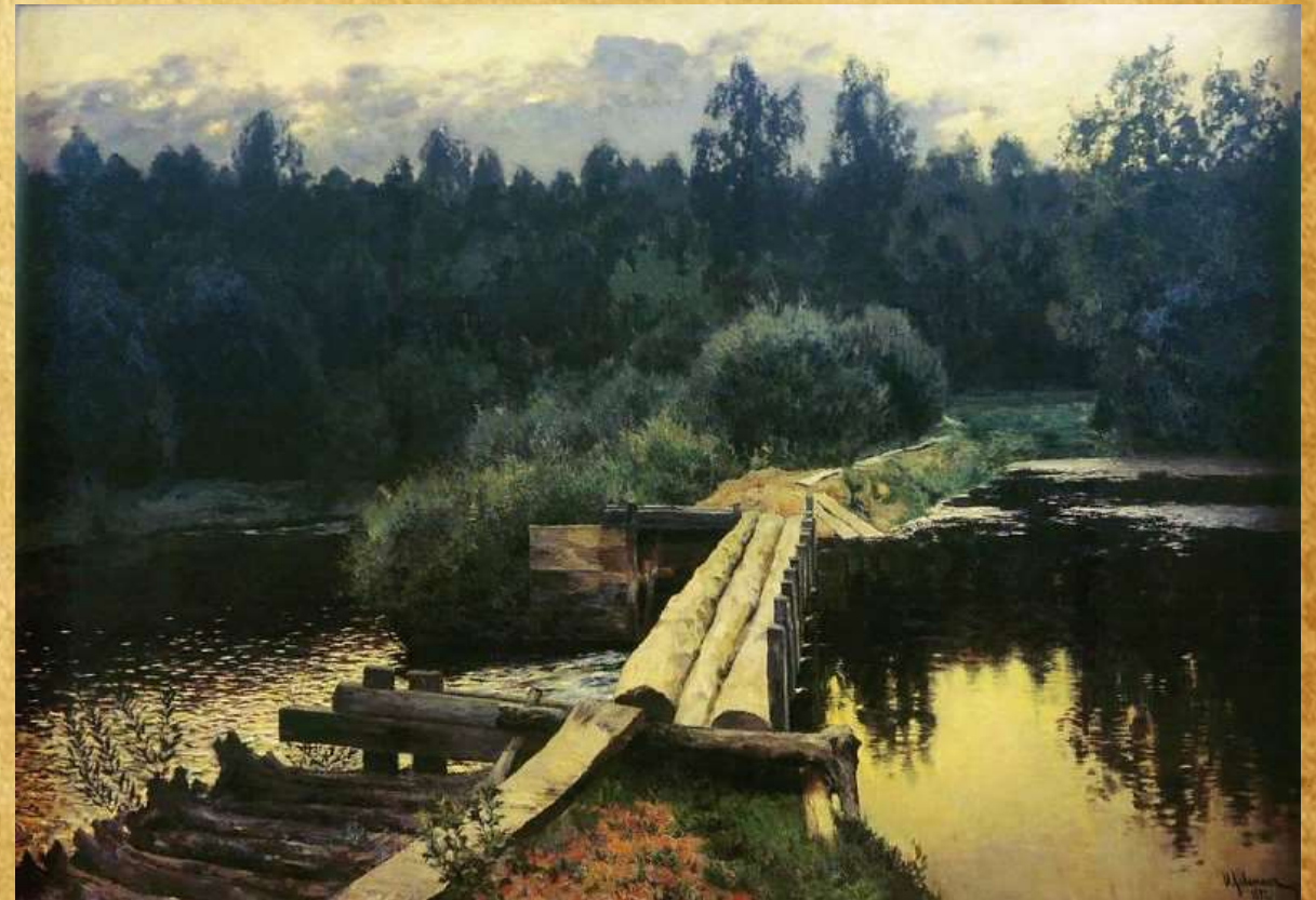
«У омута» 1892 год