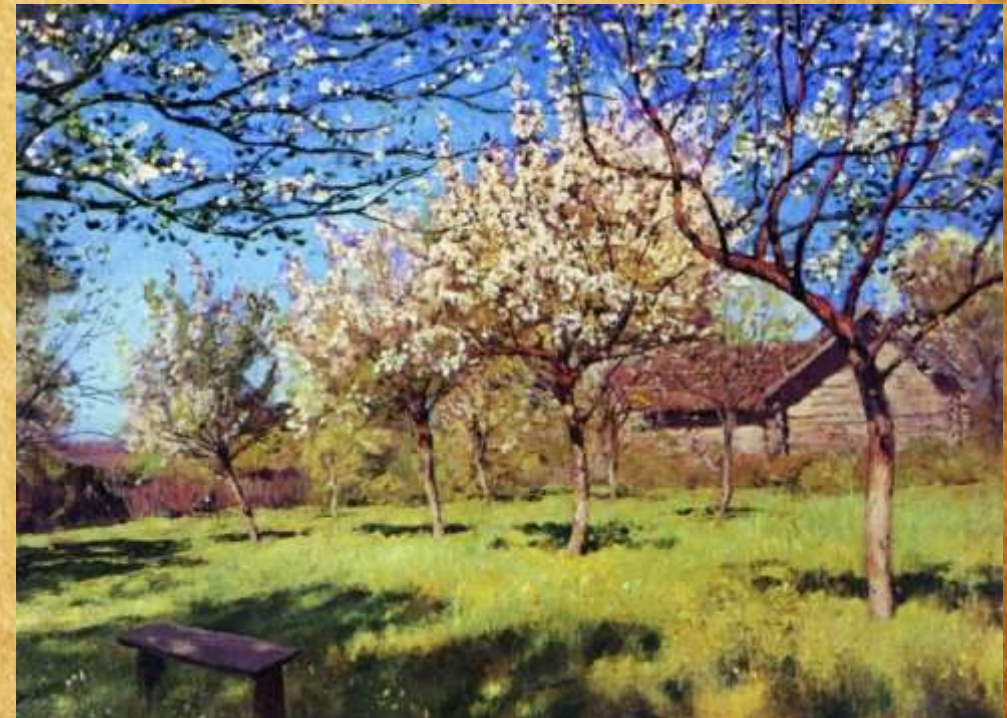
«Цветущие яблони» 1896 год

← Поэтому палитра картины необыкновенно скромна, но правдива и реалистична. Русская природа не нуждается в украшениях, поскольку сама украшает мир лучше, чем какая-либо другая.