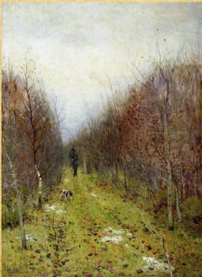
«Осень. Охотник» 1880 год

В период с 1880 по 1885 годы художник создает свои полотна. Мастер становится известным, его работы популярны. В 1885-м году, вместо диплома художника, училище выдает Левитану диплом «учителя чистописания».