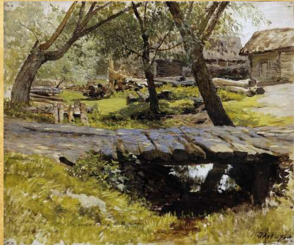
«Мостик. Саввинская слобода» 1884 год