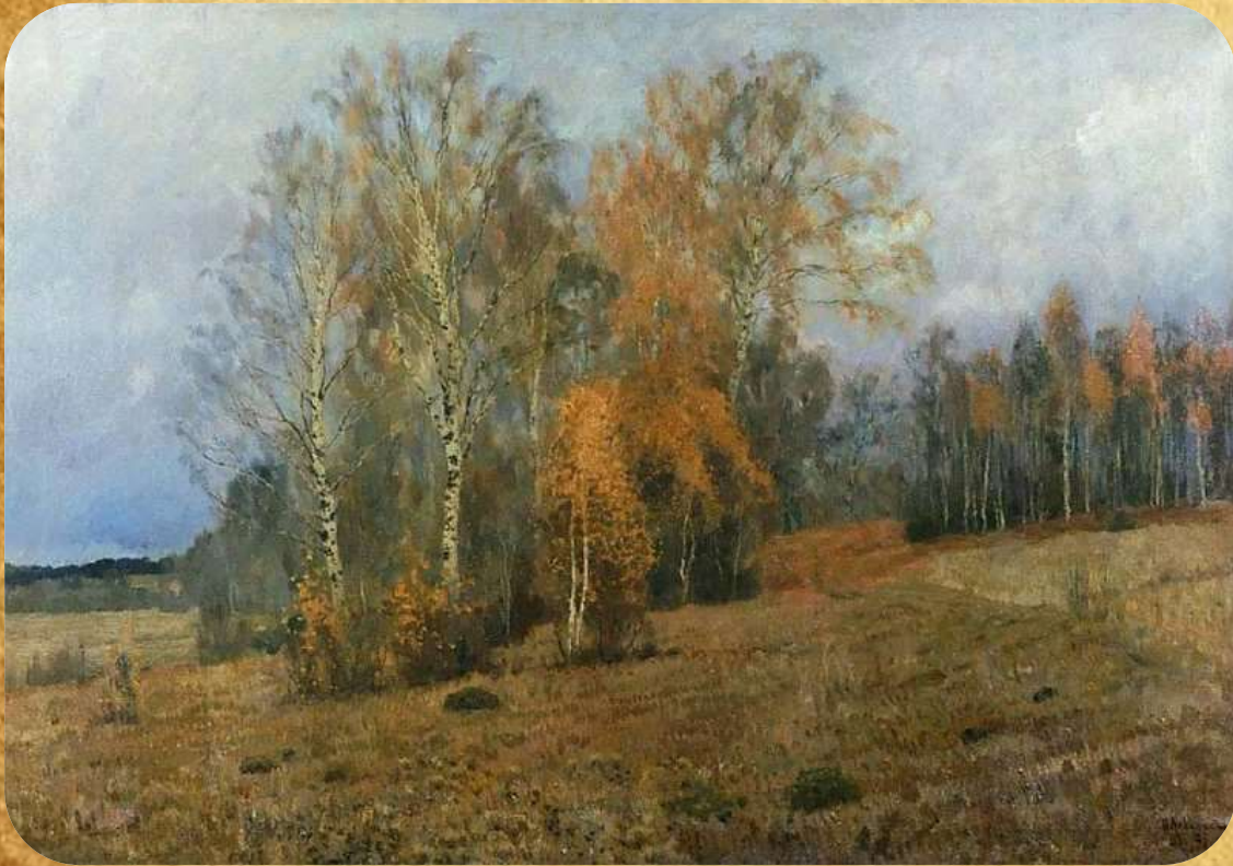
«Октябрь» 1891 год

В самом начале 90-х годов Левитан вступает в общество «передвижников». На выставках объединения появляются его шедевры: «У омута», «Лето», «Октябрь».