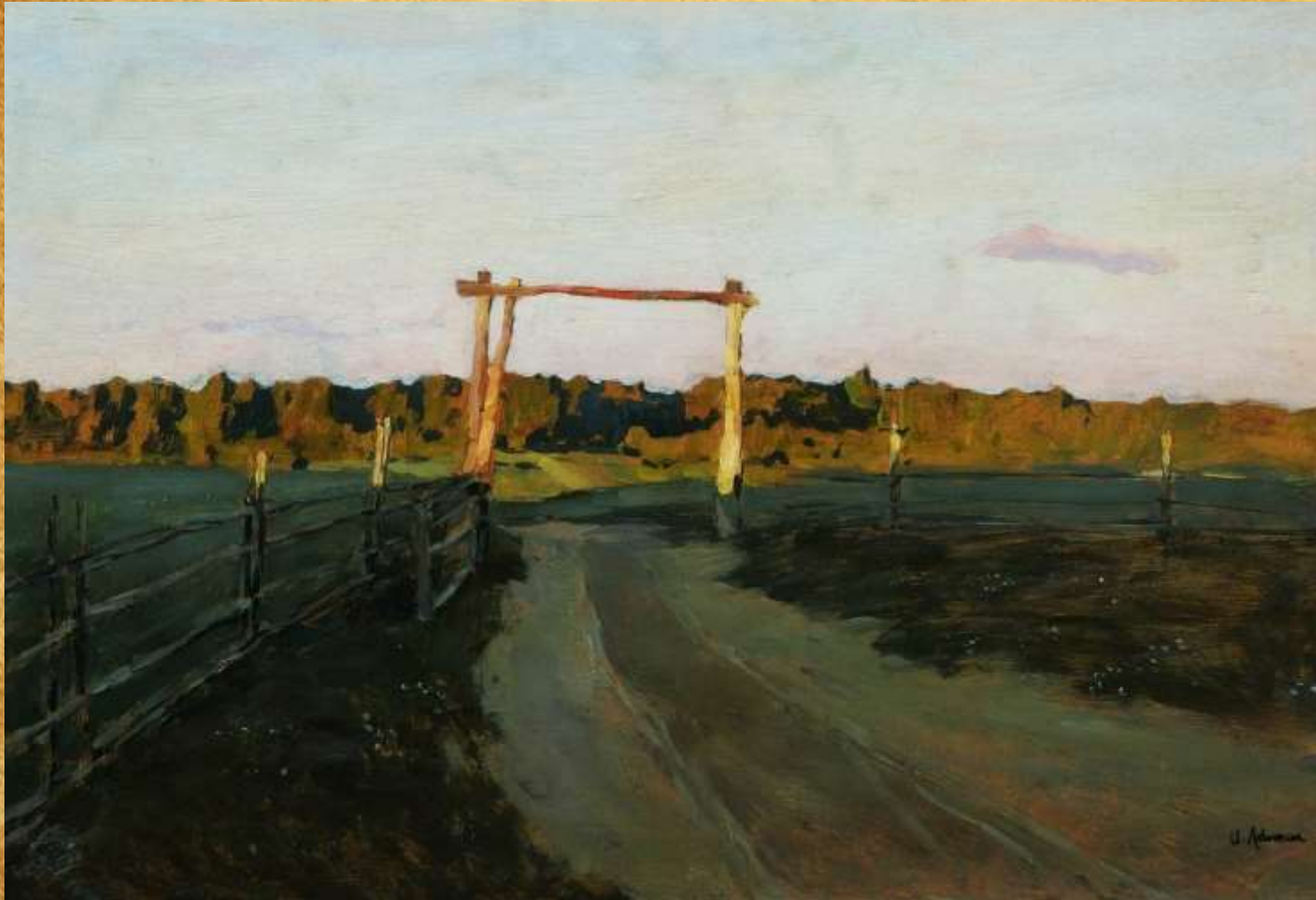
«Летний вечер» 1900 год

В 1898 году Академия художеств присудила Исааку Левитану звание академика пейзажной живописи. Несмотря на болезнь, он стал руководить пейзажной мастерской в Московском училище живописи, ваяния и зодчества, где когда-то учился сам.