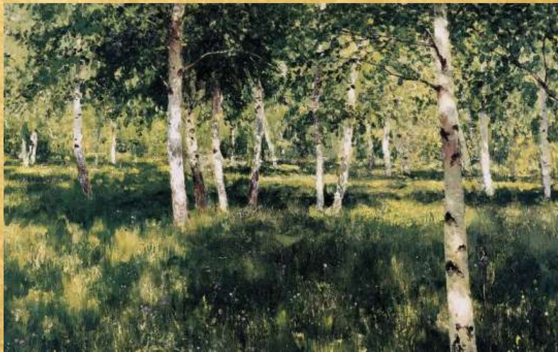
«Берёзовая роща» Исаак Левитан, 1885 год

Исаак Ильич Левитан 18 (30) августа 1860, Кибарты (ныне г. Кибартай, Литва) – 22 июля (4 августа) 1900, Москва) – великий мастер русского пейзажа.