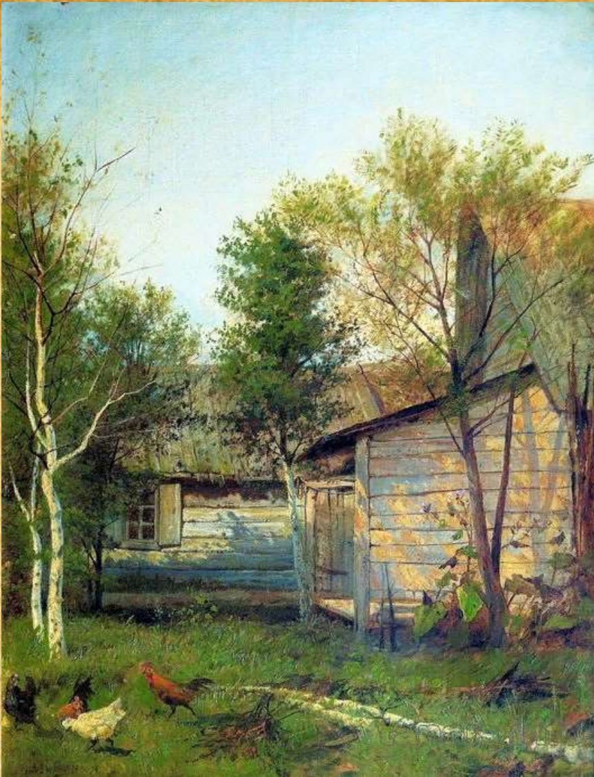
«Солнечный день. Весна». Исаак Левитан, 1877 год

В скором времени Исаак Левитан был вынужден зарабатывать деньги своим мастерством — с ранних лет он начал выполнять художественные заказы, проводил уроки рисования, рисовал для различных журналов.