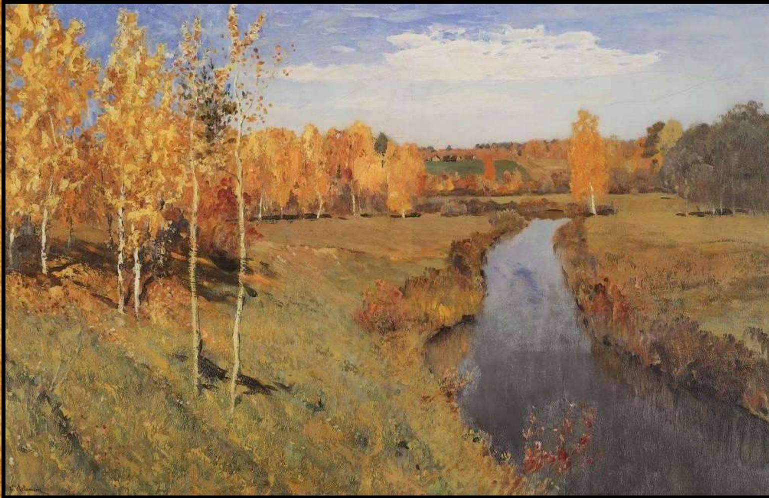
«Золотая осень» И. Левитан 1895 год

Выбранная палитра в этой картине не свойственна живописцу – слишком яркие и насыщенные цвета, но продвигаясь вглубь картины, можно заметить, как колорит становится более спокойным и привычным.