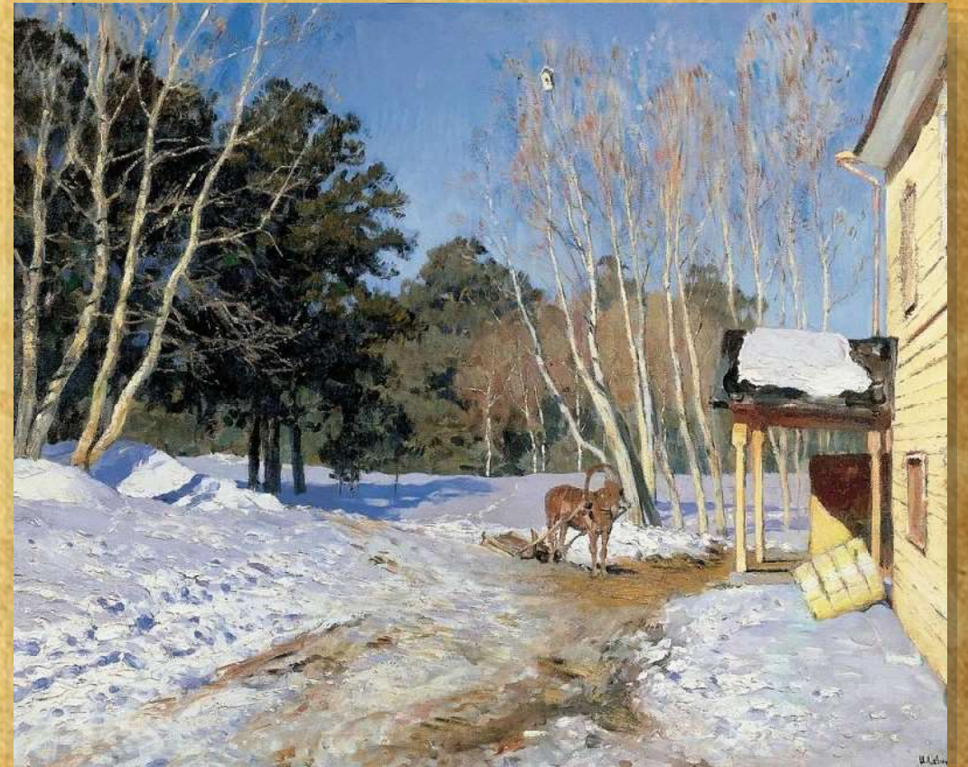
Исаак Левитан «Март» 1895 год