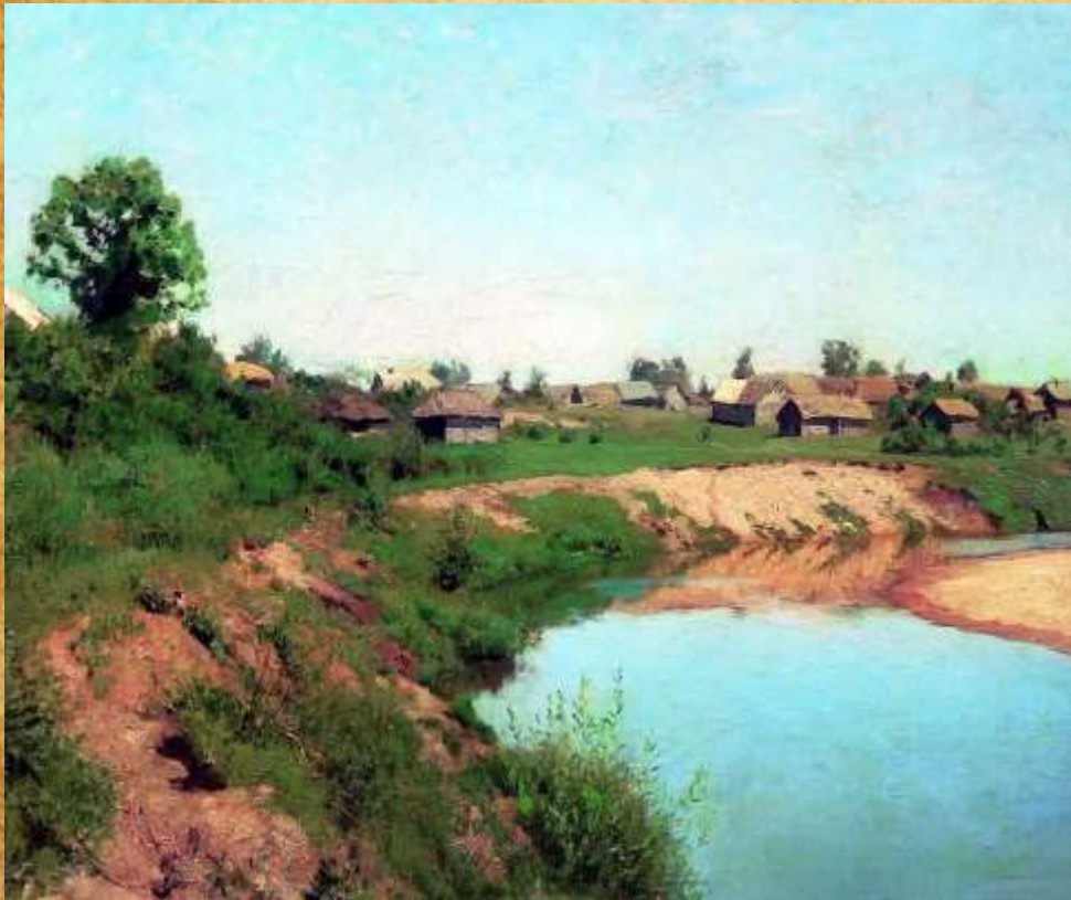
«Деревня на берегу реки» 1883 год

«Воображаю, какая прелесть теперь у нас на Руси – реки разлились, оживает все... Нет лучше страны, чем Россия! Только в России может быть настоящий пейзажист».