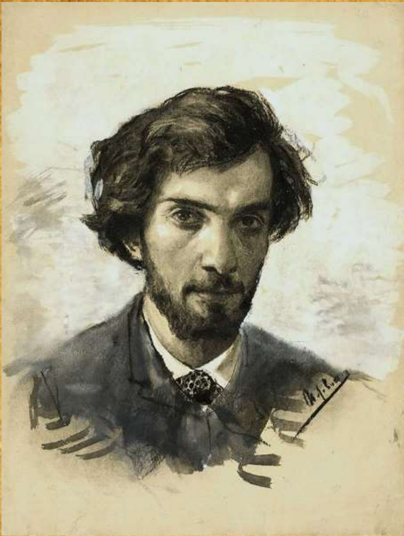
Исаак Ильич Левитан