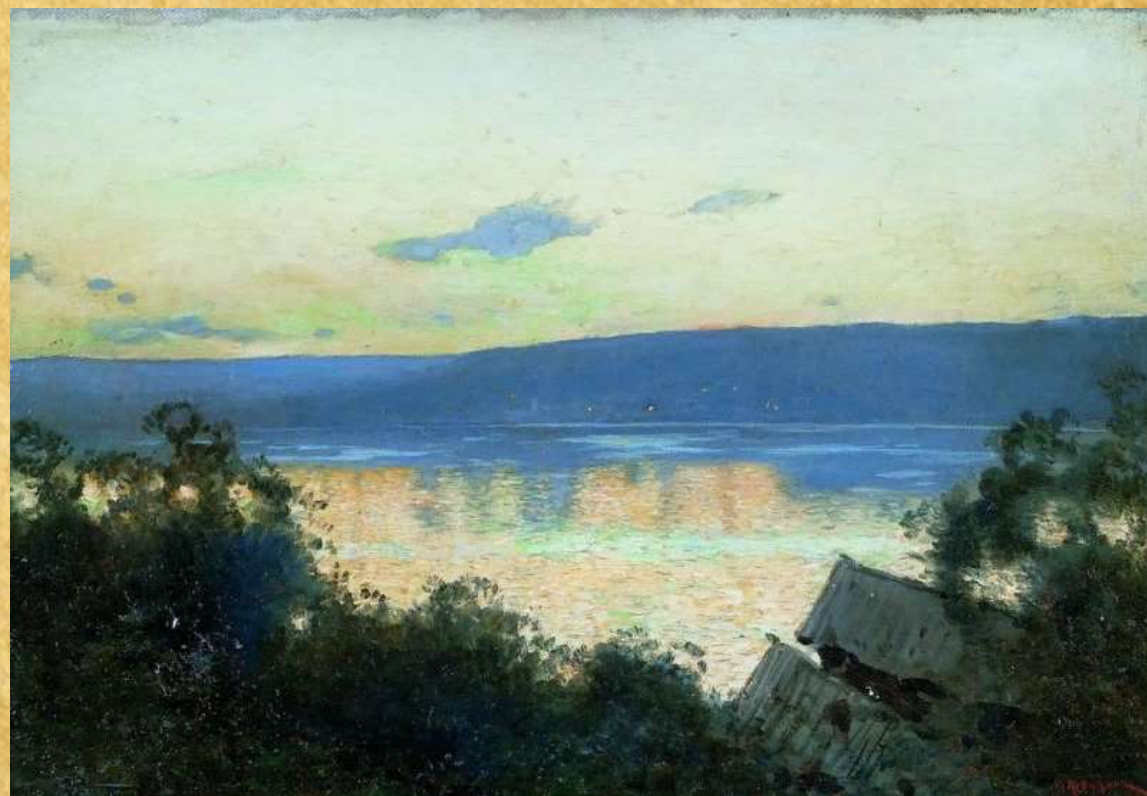
«Вечер на Волге» 1888 год