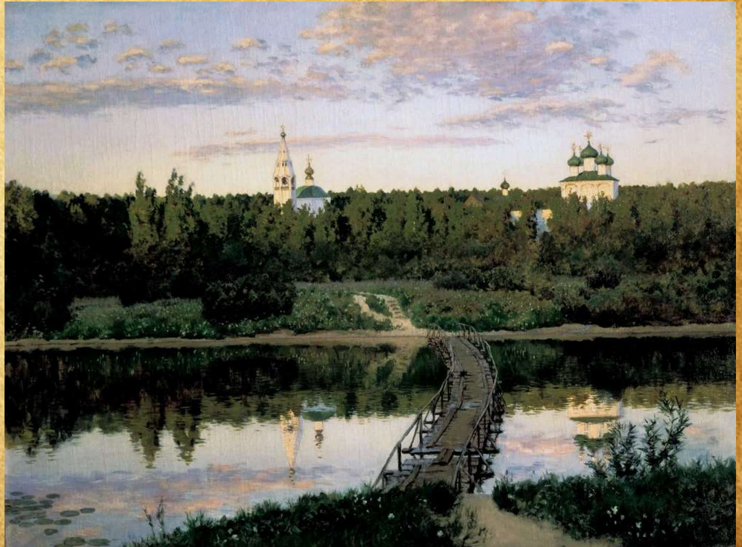
"Тихая обитель" Исаак Левитан 1890 год

При первом взгляде на картину зритель чувствует, что автор словно бы соскучился по родным просторам, с такой силой, любовью и нежностью он воссоздает на полотне приволжскую обитель.