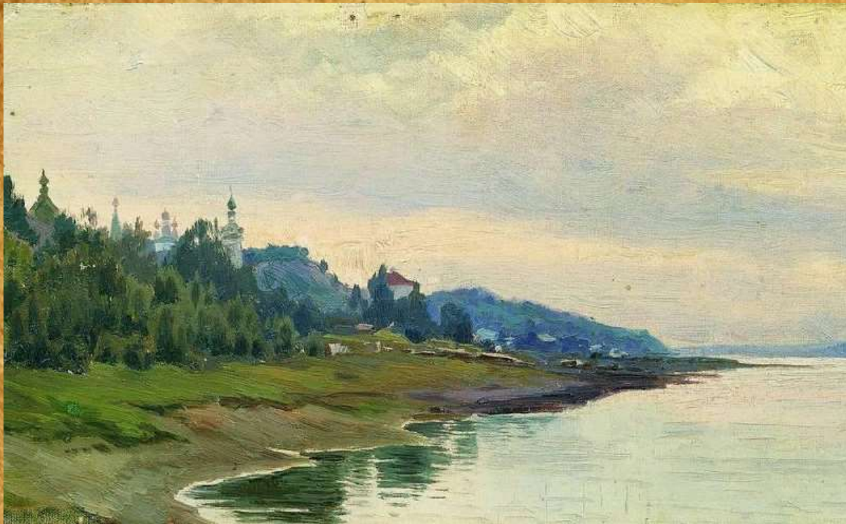
«Плѣс» Исаак Левитан, 1889 год