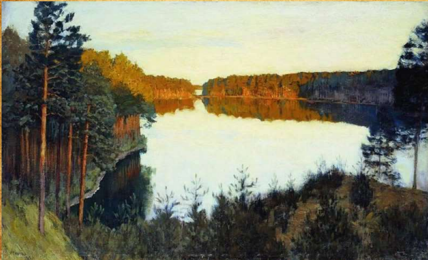
И. Левитан «Лесное озеро» 1890-е г.

Левитан силою своей любви открывал «разлитое в природе божественное нечто».