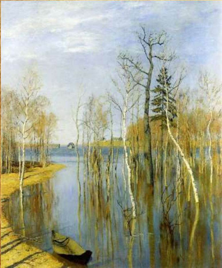
«Весна. Большая вода» 1897 год

Исаак Левитан создавал и праздничные яркие полотна. Например, «Весна. Большая вода», «Цветущие яблони». В середине 1890-х годов Исаак Левитан написал множество натюрмортов.