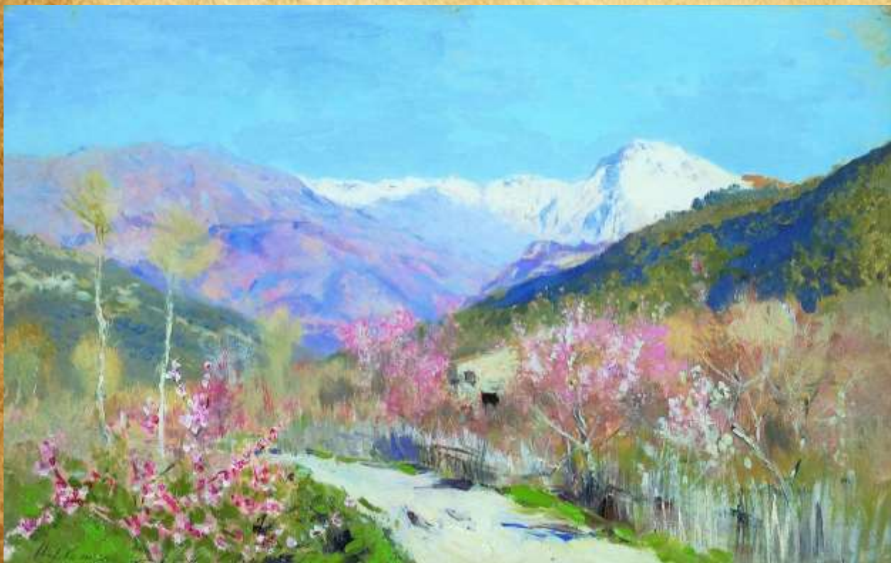
«Весна в Италии» И. Левитан 1890 год

В конце 1889 — начале 1890 года Исаак Левитан впервые побывал в Европе: он отправился в Париж на Всемирную выставку. После Франции он поехал в Италию.