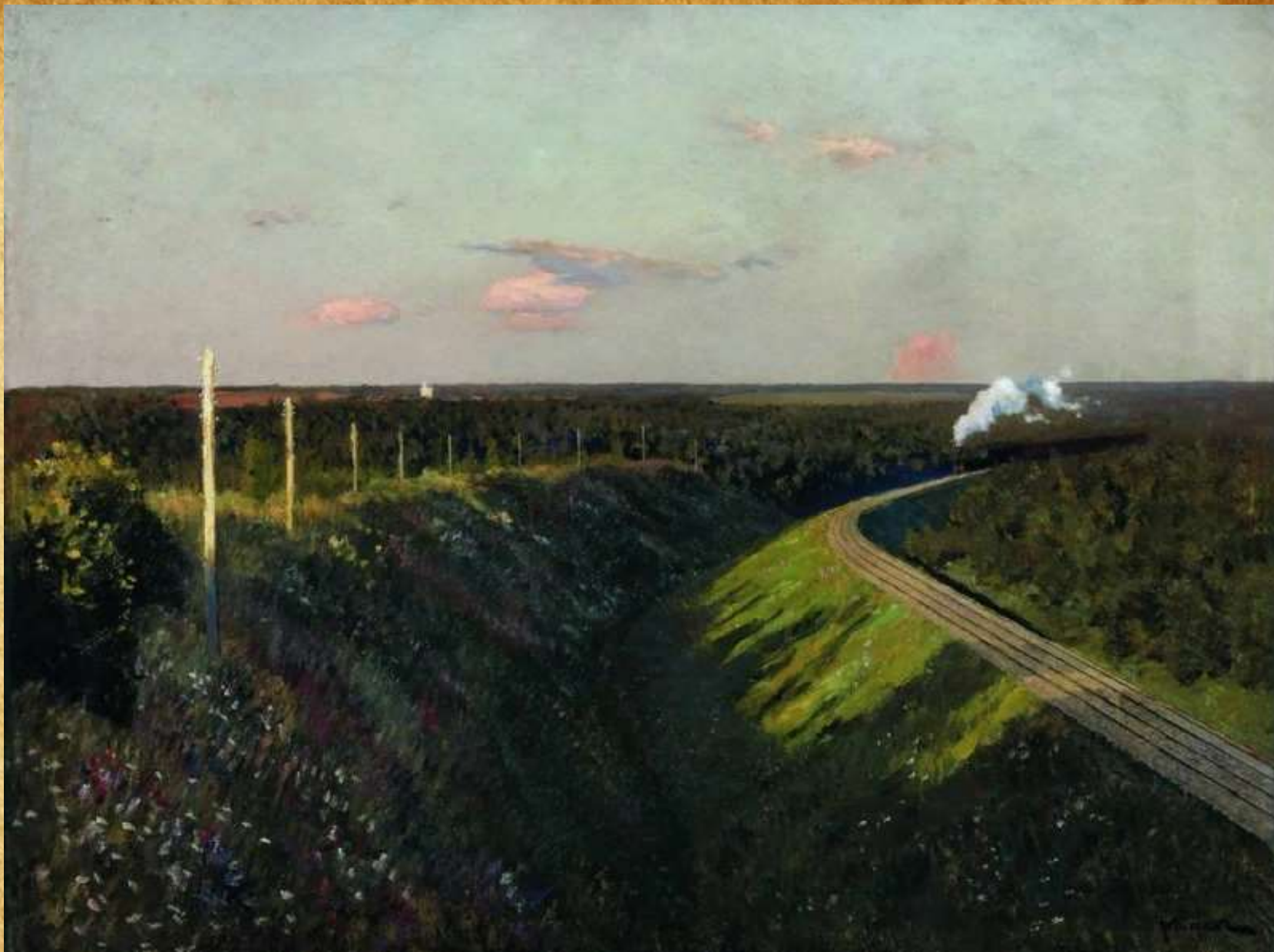
И. Левитан «Поезд в пути» 1890-е г.