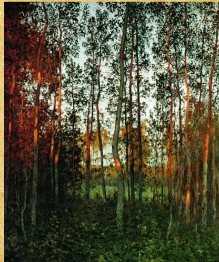
«Последние лучи солнца. Осиновый лес» 1897 год