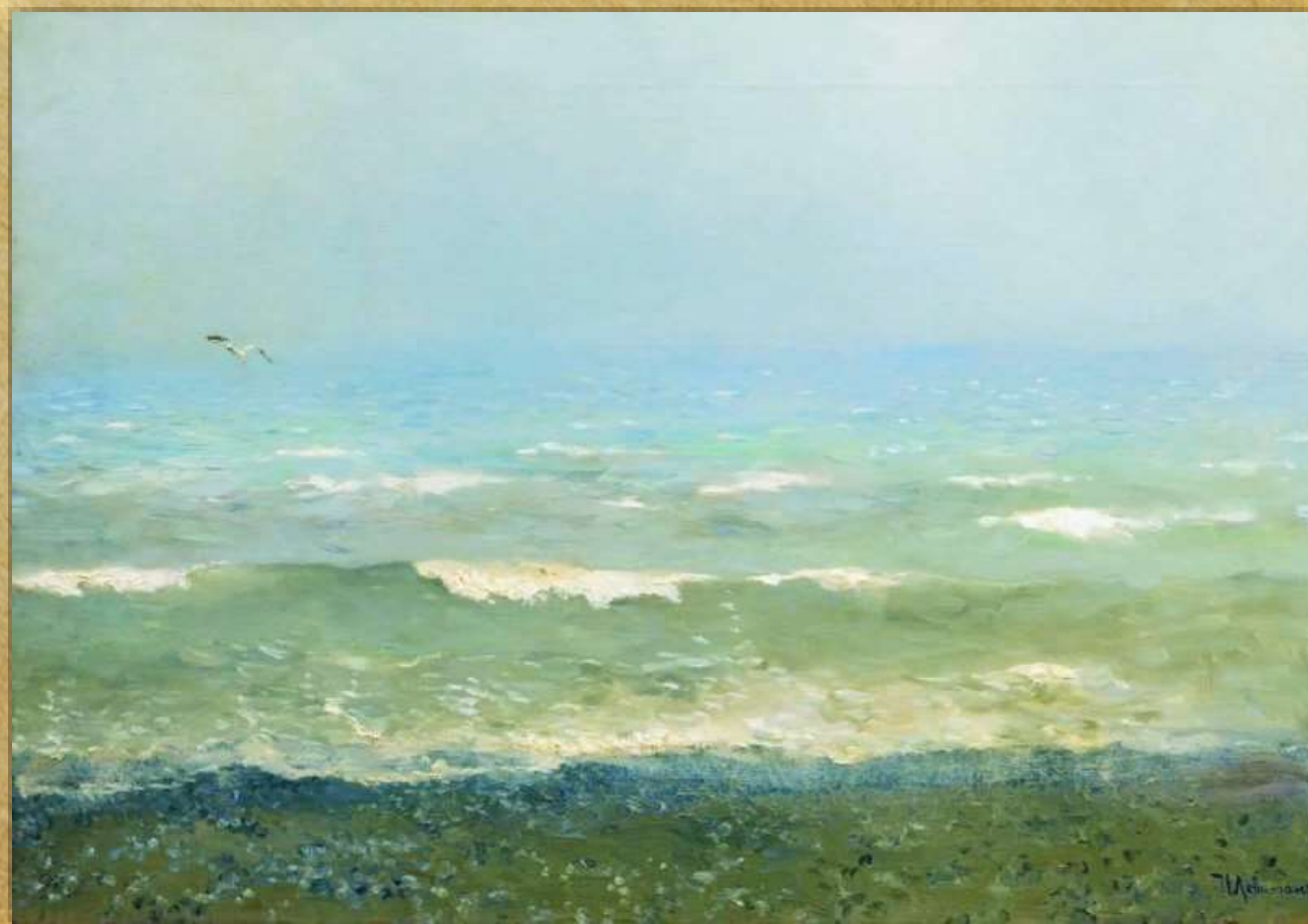
«Берег Средиземного моря» 1890 год

Из этого путешествия Левитан привез пейзажи «Берег Средиземного моря», «Близ Бордигеры на севере Италии», «Весна в Италии».