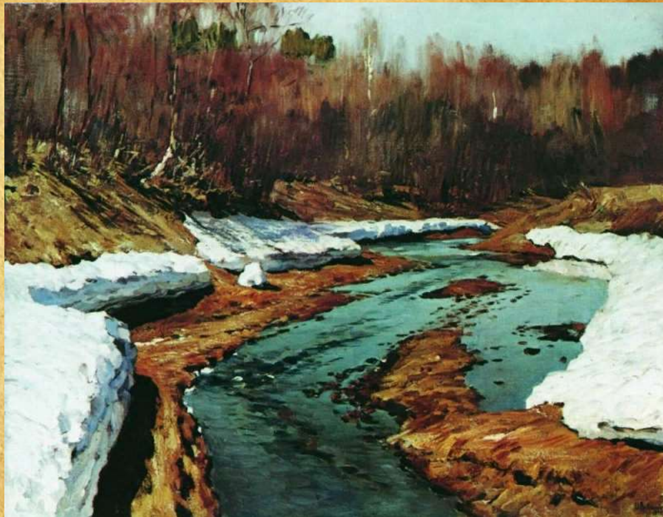
«Весна. Последний снег» 1895 год

И если учитель просил ответить, шумит на его картине дуб или не шумит, Левитан не только не удивлялся вопросу, но и очень скоро начал понимать, как живописными средствами добиться того, чтобы дуб – шумел, берёза волновалась, а природа в целом – жила, печалилась и радовалась.