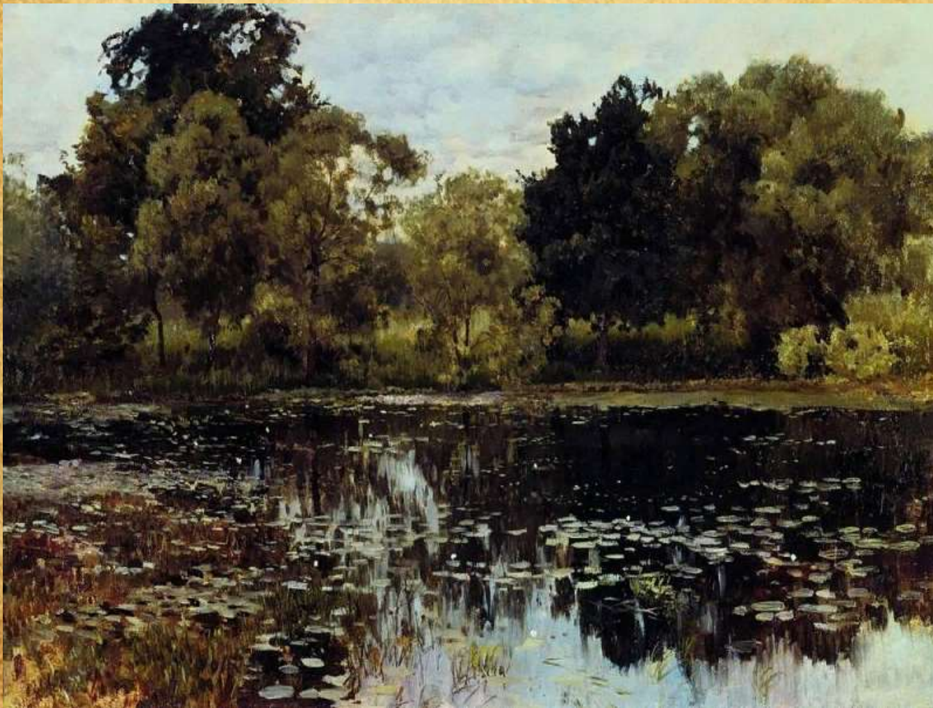
«Заросший пруд» 1887 год

Пейзажи Левитана проникнуты, с одной стороны, человеческими переживаниями (природа «печалится», «хмурится», «умиротворена», «ликует»), а с другой стороны – острым ощущением высшей гармонии. Изображая с большим чувством и правдивостью все милое и скромное, невзрачное и неброское, простое и великое в русской природе.