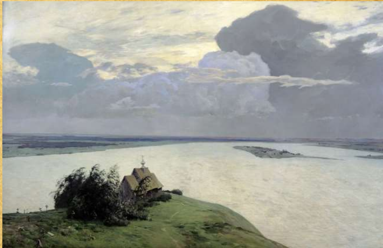
"Над вечным покоем" 1894 год

Острое чувство одиночества и беззащитности испытывает зритель перед этим вечным покоем.