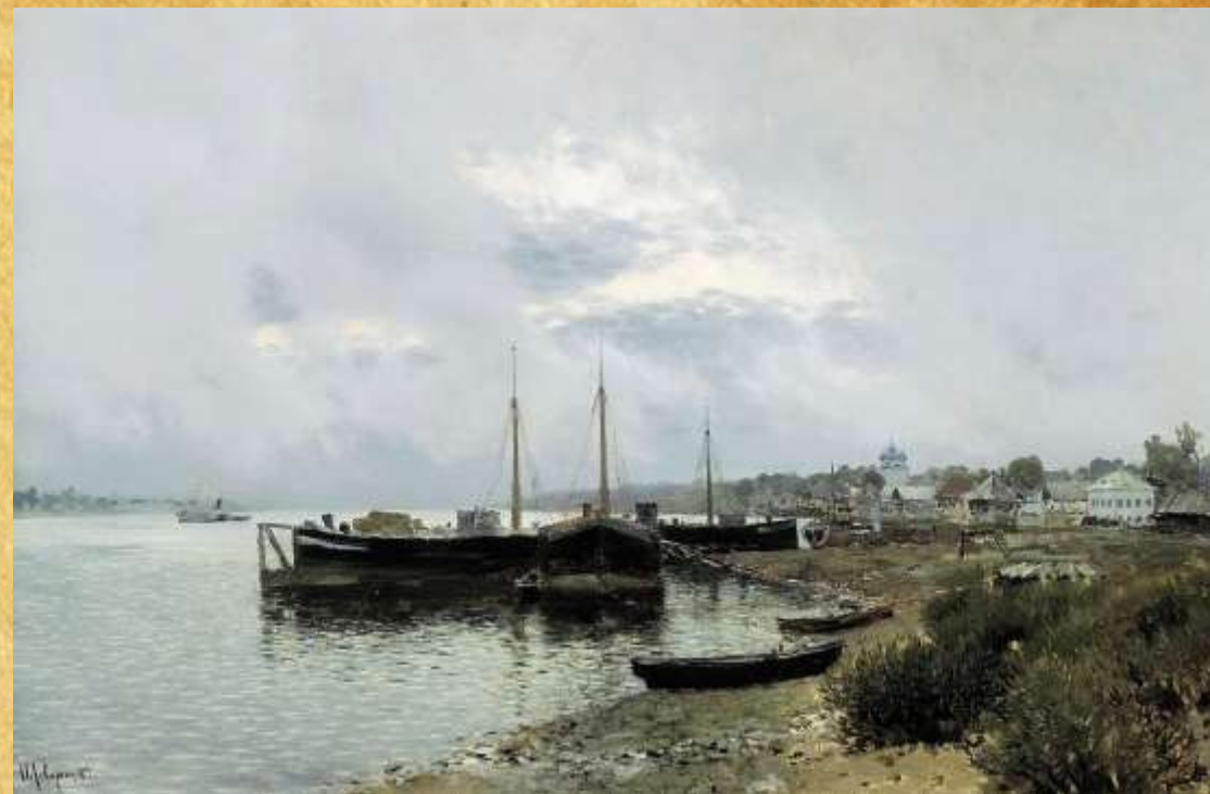
«После дождя. Плѣс» 1889 год

Следующий успех – картины «волжского» периода жизни. Благодаря многочисленным работам, созданным в окрестностях города Плѣс