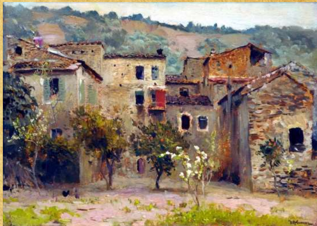
«Близ Бордигеры на севере Италии» 1890 год