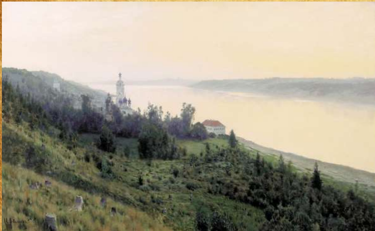
«Вечер. Золотой Плёс» 1889 год