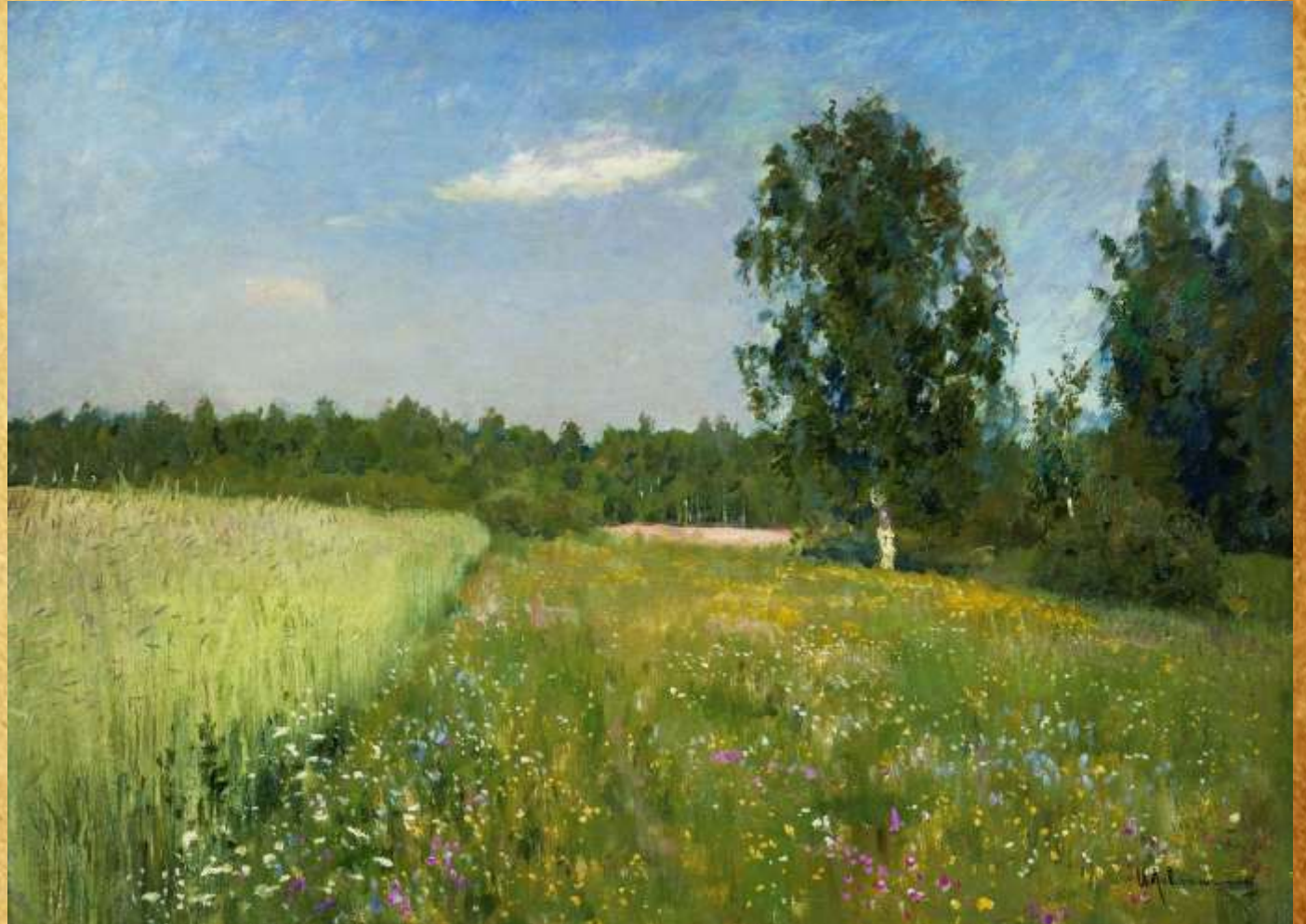
«Лето» 1892 год

Необъятное голубое небо слегка покрыто легкими облаками, которые придают легкости и невесомости небесному пространству.