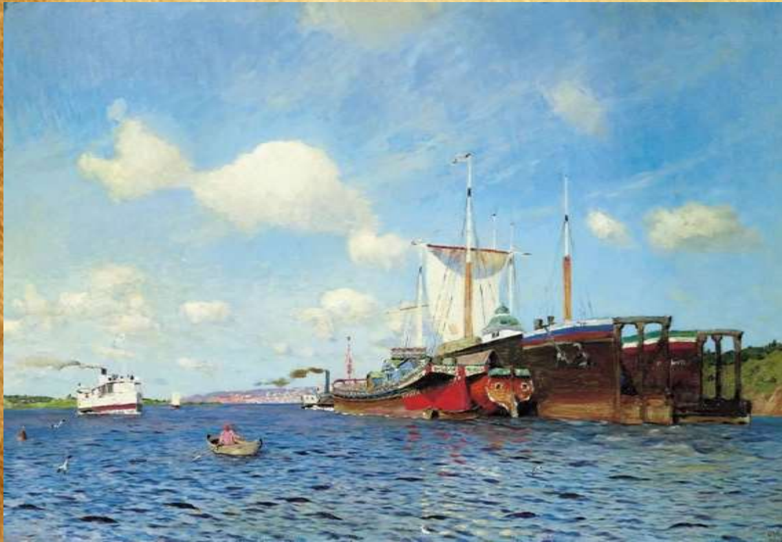
«Свежий ветер. Волга» Исаак Левитан, 1895 год

В последующие годы художник трудится не покладая рук – «Март», «Золотая осень», «Свежий ветер. Волга» - это лишь те, что были при жизни мастера признаны шедеврами. В 1898 году Исаак Левитан получает звание академика и право преподавать в Художественном училище.