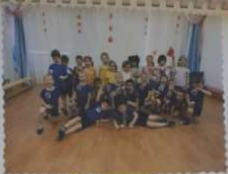
Дневник Здоровья Старшая группа «Теремок»